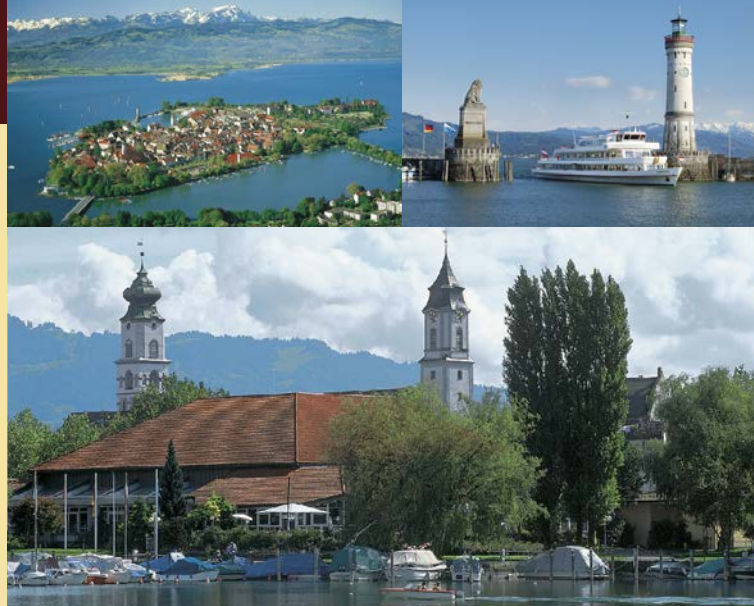
Inselhalle Lindau | Zwanzigerstraße 12 | 88313 Lindau – Insel (Bodensee)