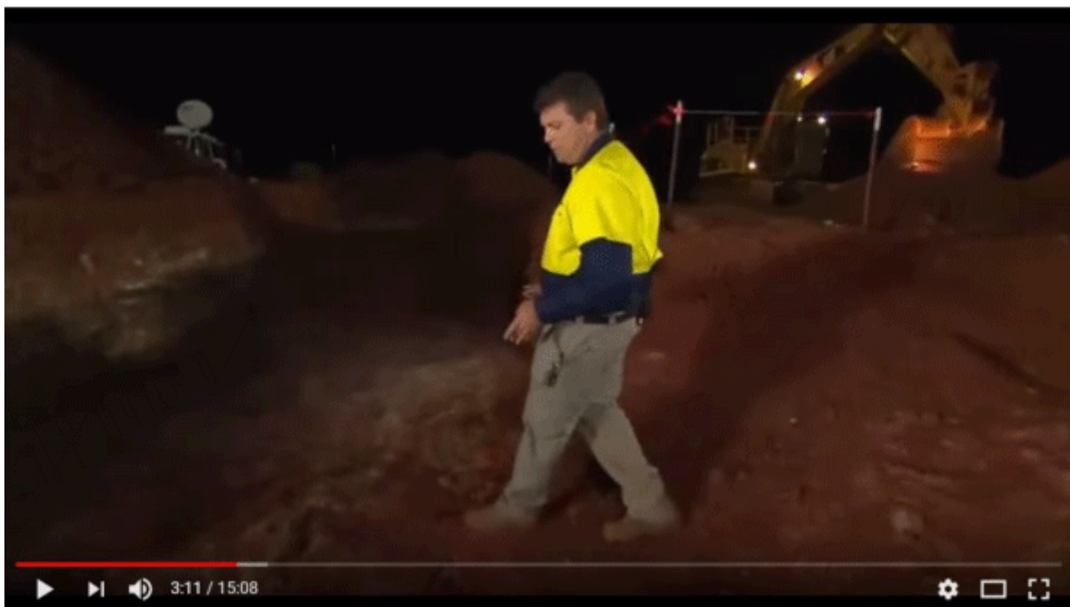
Novo Resources' live stream of gold exploration at Purdy's Reward - Denver Gold Forum - 26Sep2017

Novo selbst ist von ca. 0,80 CAD auf über 6 CAD gestiegen: