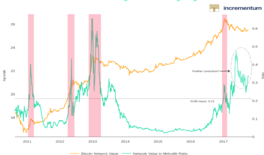
Grafik 2: Bitcoin Überbewertung im Oktober aufgezeigt