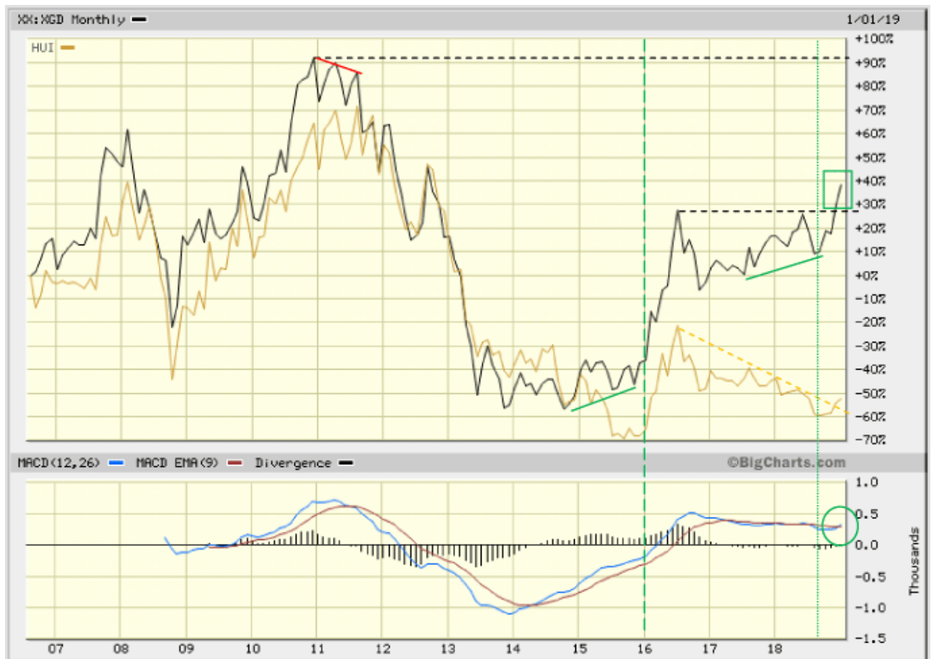
Abb. 2: Australischer Goldminen-Index (schwarz) versus Nordamerikanischer Goldminen-Index (gelb) Quelle: www.bigcharts.com , bearbeitet durch GR Asset Management

ferner Zukunft - die australischen, als auch die nordamerikanischen Goldminen, zum Allzeit-Hoch aus dem Jahr 2011 führen sollte!