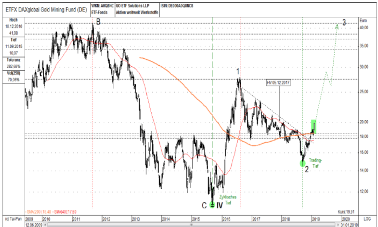
Abb. 3: DAX Global Gold Mining ETF in EUR von 06/2009 bis 01/2019