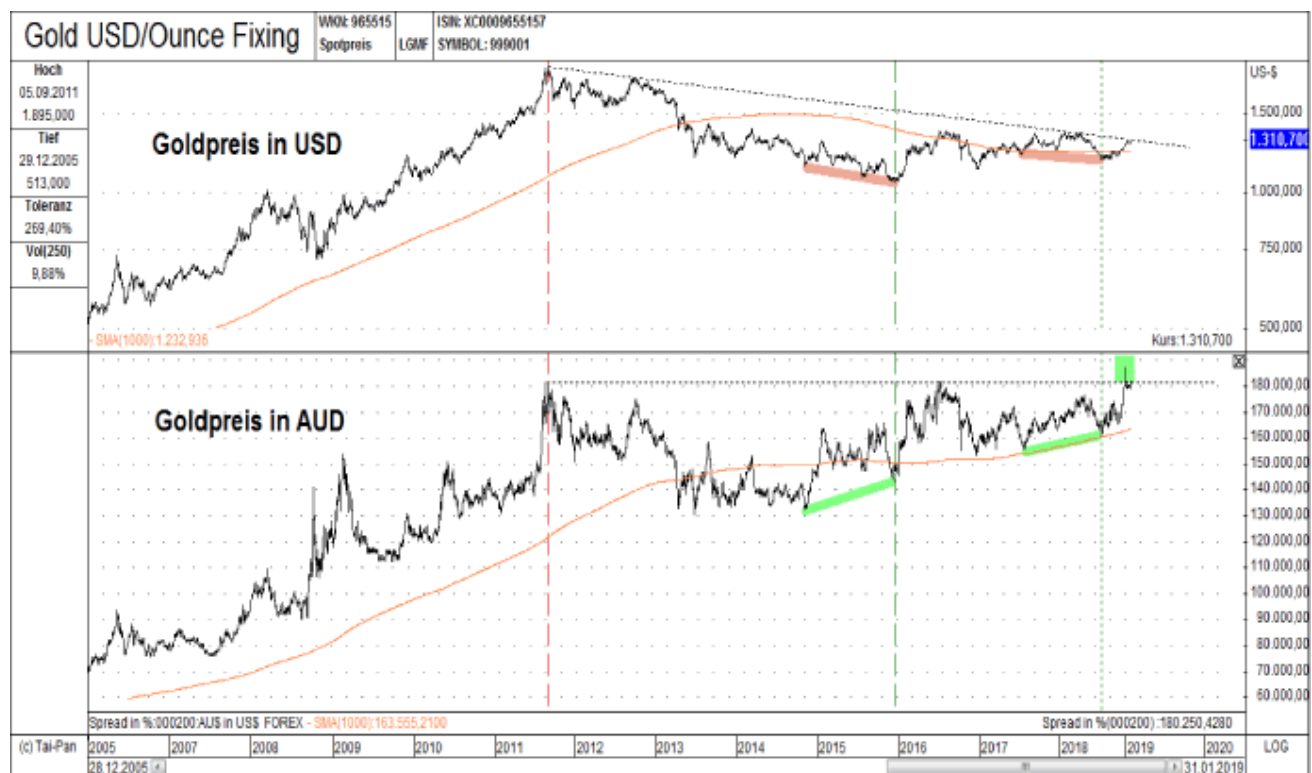
Abb. 1: Goldpreis in USD (oben) versus Goldpreis in AUD (unten) von 12/2005 bis 01/2019

Während sich an beiden Tiefpunkten die negativen Expertenmeinungen zum Thema Gold überschlugen, wiesen wir beides Mal explizit auf die einmalige Kaufgelegenheit im Goldsektor hin (siehe hierzu: Historische Extremdaten im Goldsektor signalisieren signifikantes Tief ). Das neue Allzeit-Hoch beim Goldpreis in AUD impliziert - im Rahmen seiner Vorlaufindikation - in nicht allzu ferner Zukunft zwangsweise auch ein neues Allzeit-Hoch beim Goldpreis in USD (inkl. in EUR)!