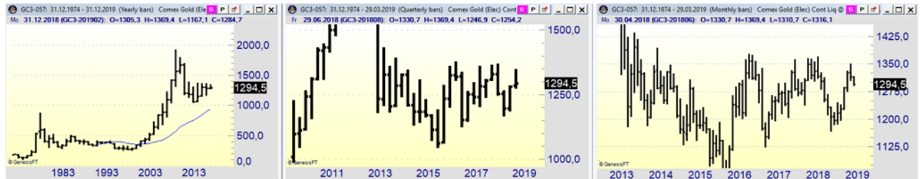
Goldpreis Jahreschart, Quartalschart und Monatschart