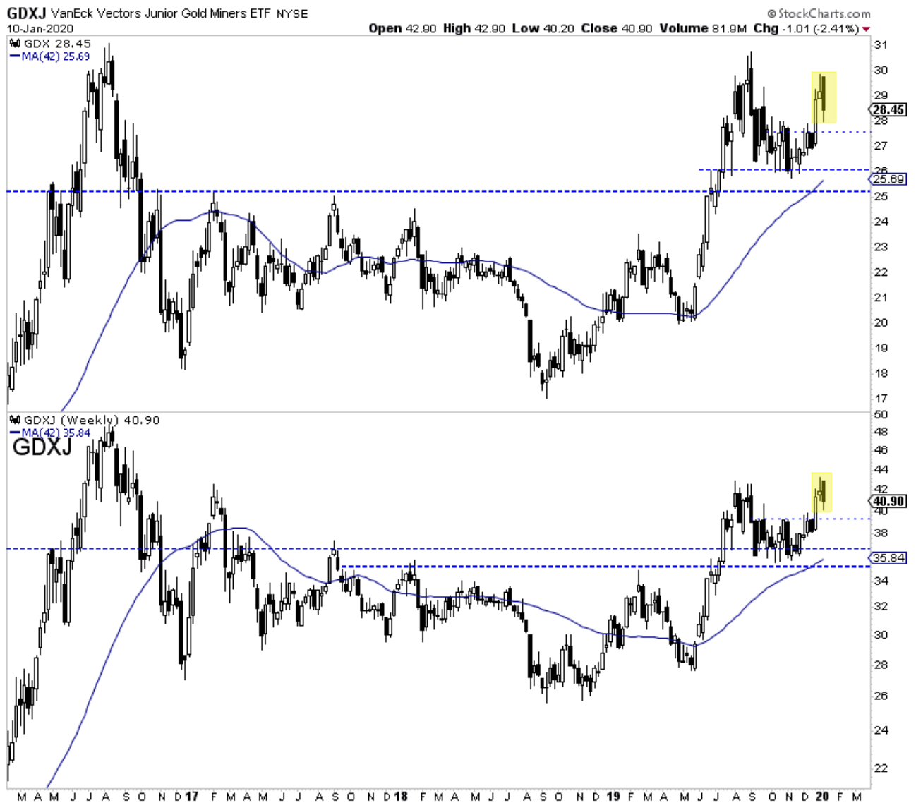
GDX & GDXJ Wochencharts

Wir erwarten etwas ähnliches bei den Metallen. Der Tageskerzenchart unten hebt die bearischen Reversals hervor, die am Mittwoch stattfanden.