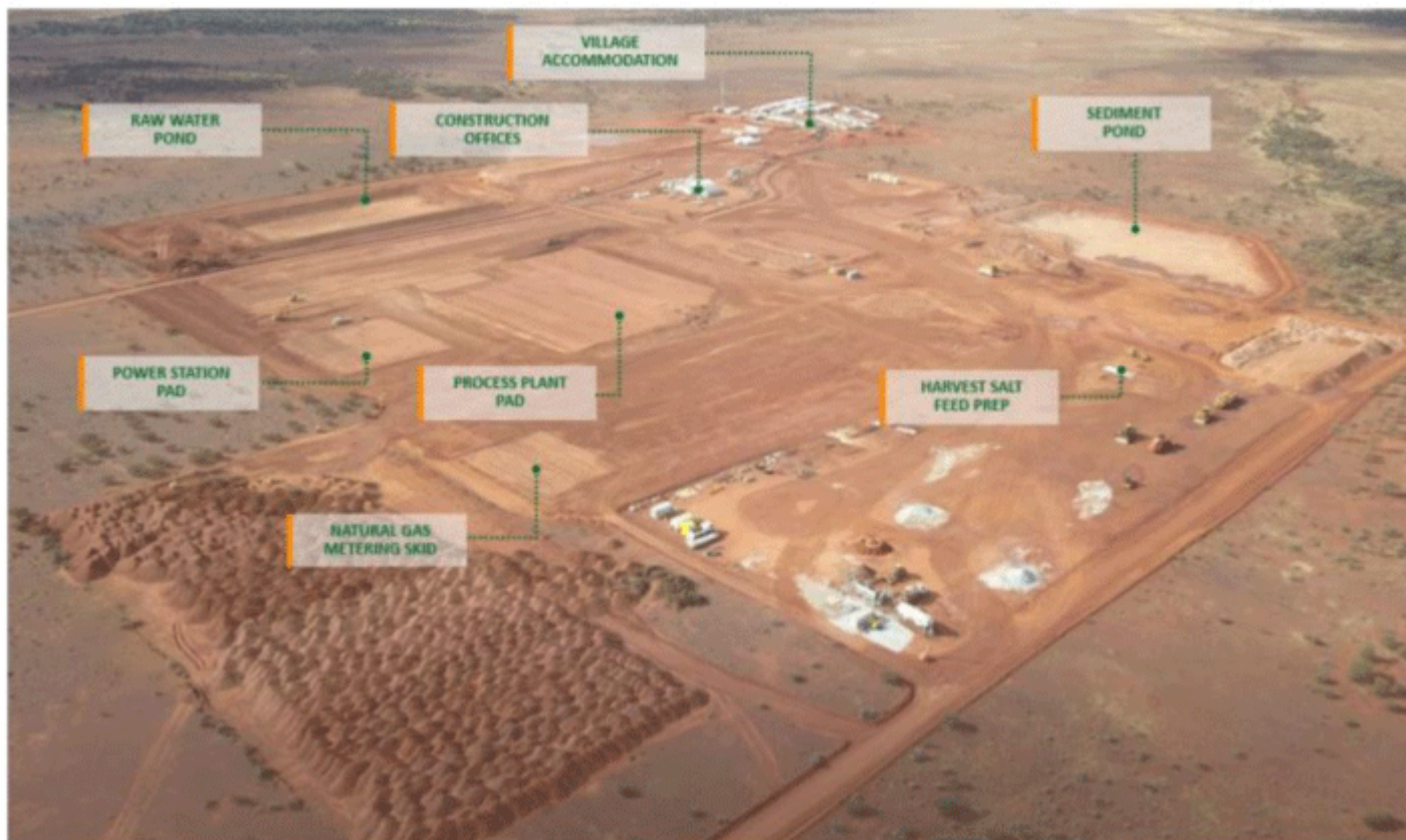
Figure 1: Process Plant and NPI site map

Zudem zeigt sich der Pottasche-Markt trotz Covid-19 stabil, was wenig verwundert. Gegessen wird immer, somit werden auch Dünger gebraucht.