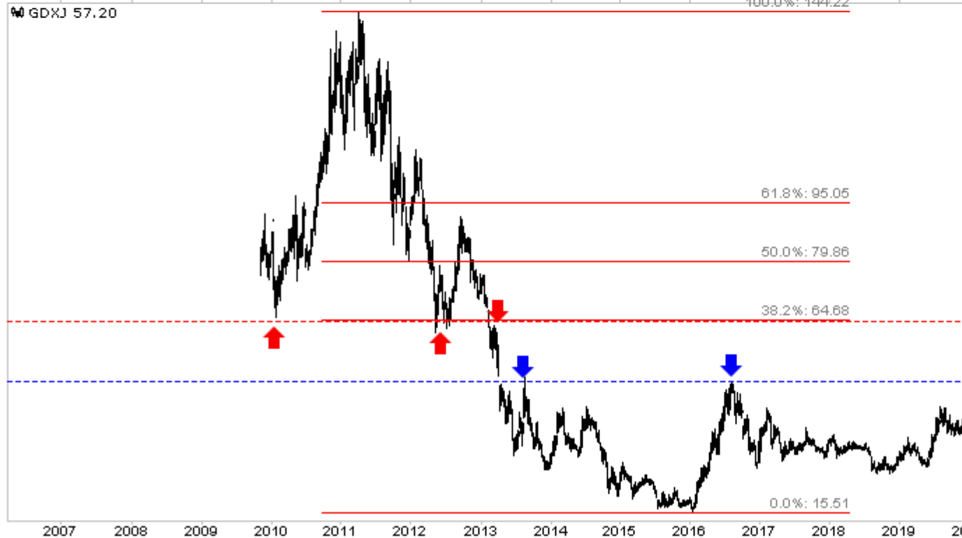
Wöchentliche Kerzen von GDX & GDXJ

Wenn wir uns den Metallen zuwenden, sehen wir in den letzten zwei Wochen zwei offensichtlich baerische Kerzen.