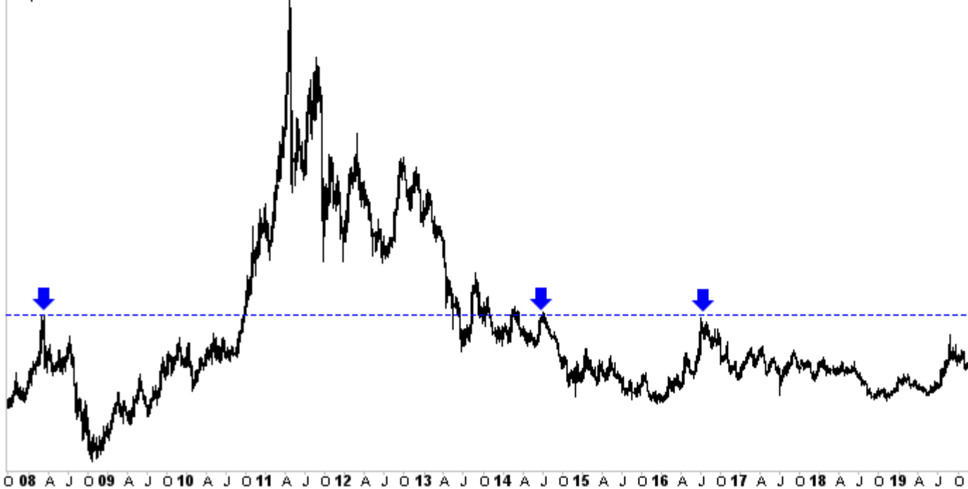
Wochenchart für Gold & Silber

Korrekturen sind eine Frage von Preis und Zeit. Manchmal sind sie preislich heftig, aber zeitlich kurz. Manchmal sind sie preislich moderat, aber dauern lange an.