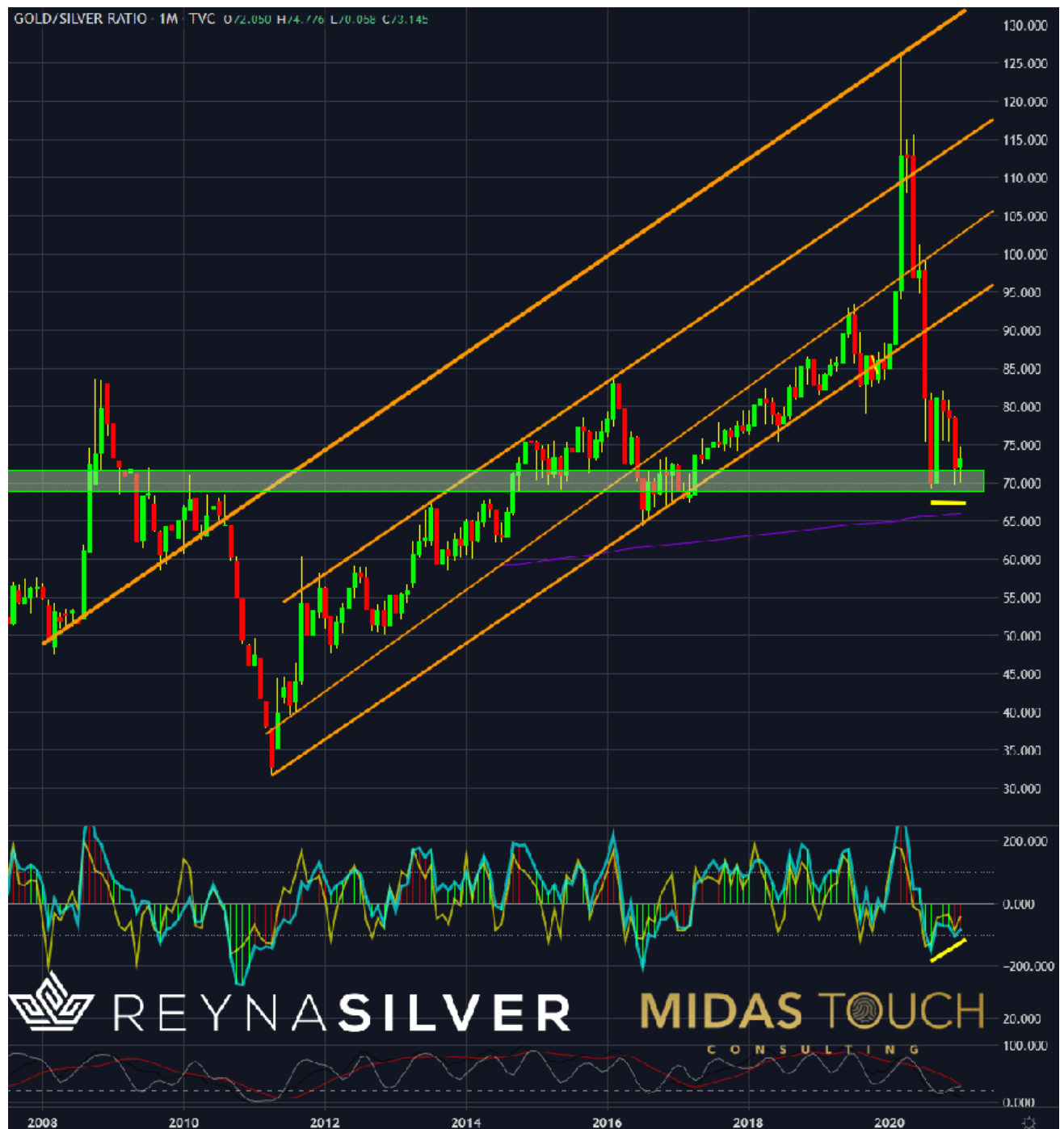
Gold/Silber-Verhältnis, Monatschart vom 28. Januar 2021

Aber das ist noch nicht alles. Mit Stand vom 11. Dezember 2020 liegt die einjährige Preisveränderung von Silber bei 41,94% und die einjährige Preisveränderung von Gold bei 24,75%.