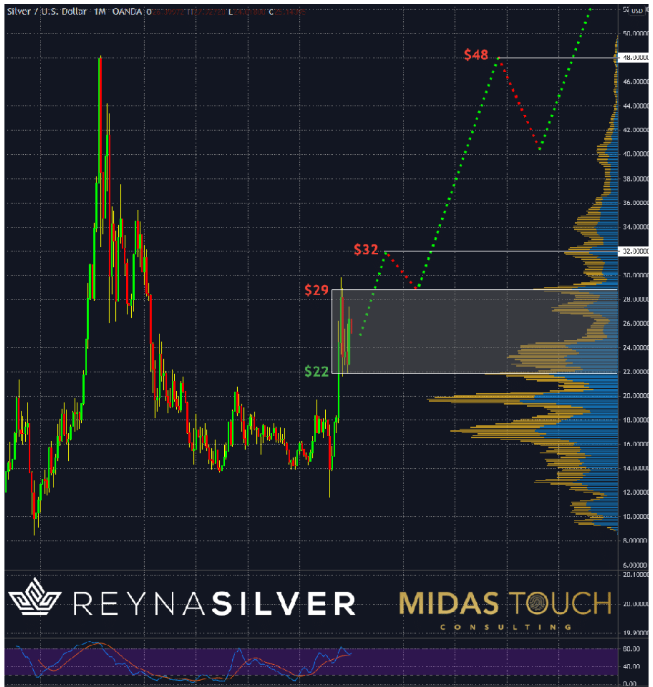
Silber in US-Dollar, Monatschart vom 28. Januar 2021

Silber sieht sehr bullisch aus, da es in seiner Seitwärtsspanne seit März letzten Jahres nicht tief zurückgegangen ist (27,5%). Daher halten wir es für sinnvoll, die Fundamentaldaten genauer zu betrachten, wenn es um Zielprojektionen für größere Zeiträume geht.