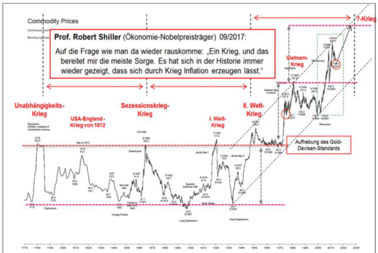
Abb. 1: Rohstoffpreisentwicklung in USD, inkl. signifikanter Kriegsereignisse von 1770 bis 2014

"Als wir vor 15 Jahren strategisch in den Gold- und Rohstoffsektor wechselten, wiesen wir bereits damals auf den Umstand hin, dass jede säkulare Rohstoff-Hausse unzertrennbar mit Geldentwertung (Inflation) und geopolitischen Unruhen (Krieg) einhergeht. Die Wirtschaftsgeschichte der vergangenen 250 Jahre ist voll mit Beispielen davon (siehe hierzu bitte Abb. 1).