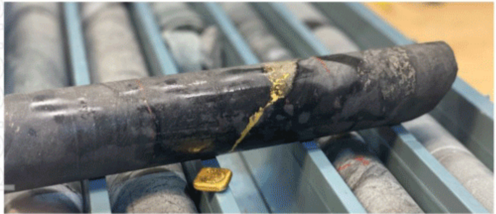
Figure 1. NQ core from diamond hole TCKD0003 showing the visible gold with a one ounce gold nugget for scale