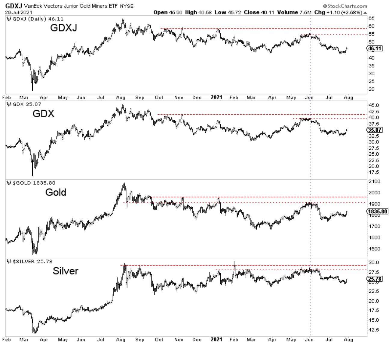
Tägliche Balkencharts GDXJ, GDX, Gold, Silber

Silber dieses Schicksal fast vermeiden konnte). Insbesondere die Bergbauaktien konnten sich zwar wieder erholen, erreichen aber im Vergleich zum Höchststand von Anfang Juni immer noch ein niedrigeres Hoch.