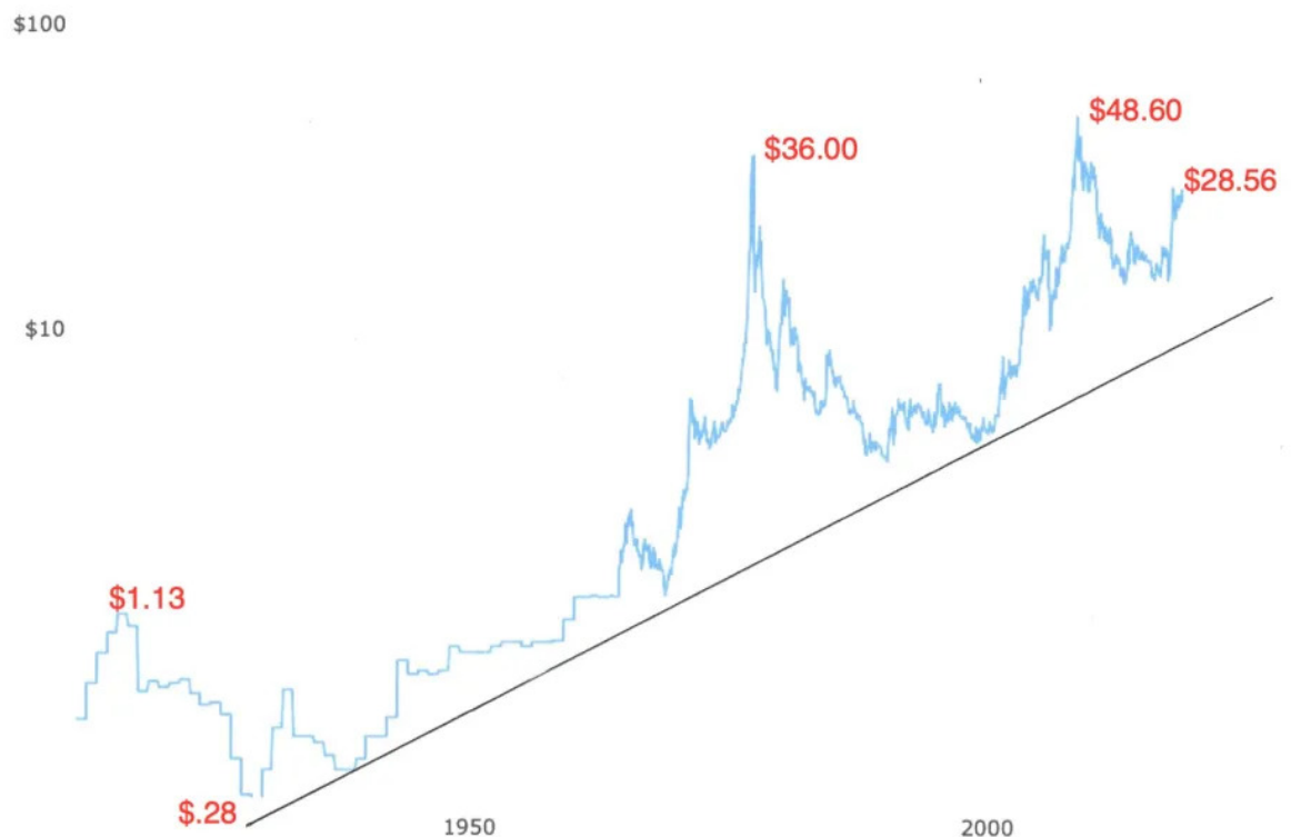
Silberpreis - 100-jähriger Chart

Manchmal wird die Fantasie zur Realität. Und ein anderes Mal zügelt eine Dosis Realität Fantasien übergroßen und ungerechtfertigten Ausmaßes. Einige Silberinvestoren und -analysten könnten eine Dosis Realität vertragen. Hier ein Chart der Silberpreise bis 1915: