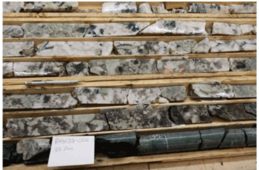
Figure 3: Spodumene pegmatite, RHW22-006, half core. The other half will be sent to ALS laboratories for assays on 28/04/2022

Das Unternehmen sendet die Auswertungen nun ins Labor, um die Gehalte zu erfahren. Positiv ist, dass die üblichen "Pfadfinder" wie Feldspat und Quarz sichtbar sind: