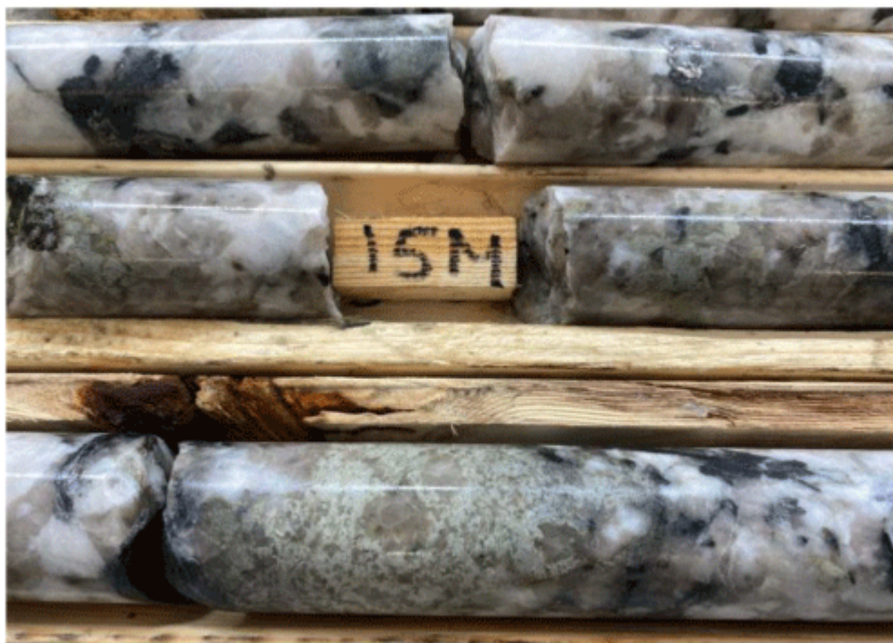
Figure 9: RHW22-006 pegmatite close-up, the black mica is mosutomilite (Rb rich mineral), with quartz and feldspar visible

Das Unternehmen sendet die Auswertungen nun ins Labor, um die Gehalte zu erfahren. Positiv ist, dass die üblichen "Pfadfinder" wie Feldspat und Quarz sichtbar sind: