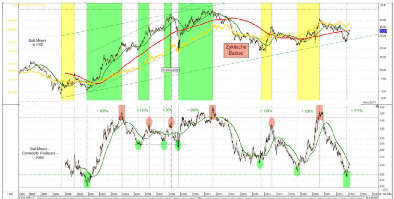
Abb. 4: BGF World Gold Miners (schwarz, oben) und Gold in USD/oz (gelb, oben) versus BGF World Gold Miners – MSCI World Commodity Producers – Ratio (unten) von 02/1995 bis 01/2023