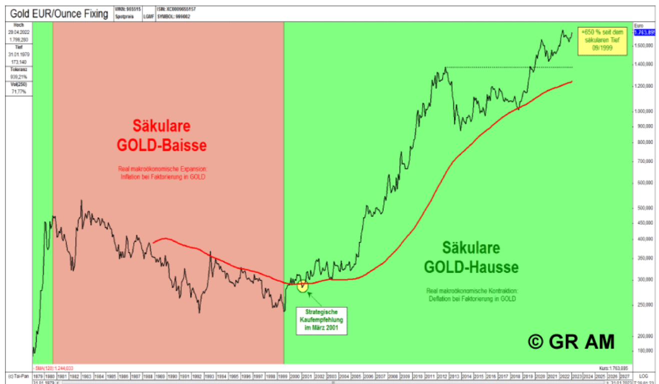
Abb. 6: Goldpreis in EUR/Unze (vor 1999 ECU) auf Monatsschlusskursbasis von 12/1978 bis 01/2023