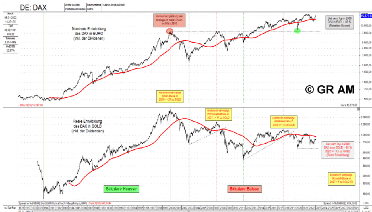
Abb. 7: DAX in EUR (oben) versus DAX in Unzen Gold (unten) von 01/1976 bis 01/2023