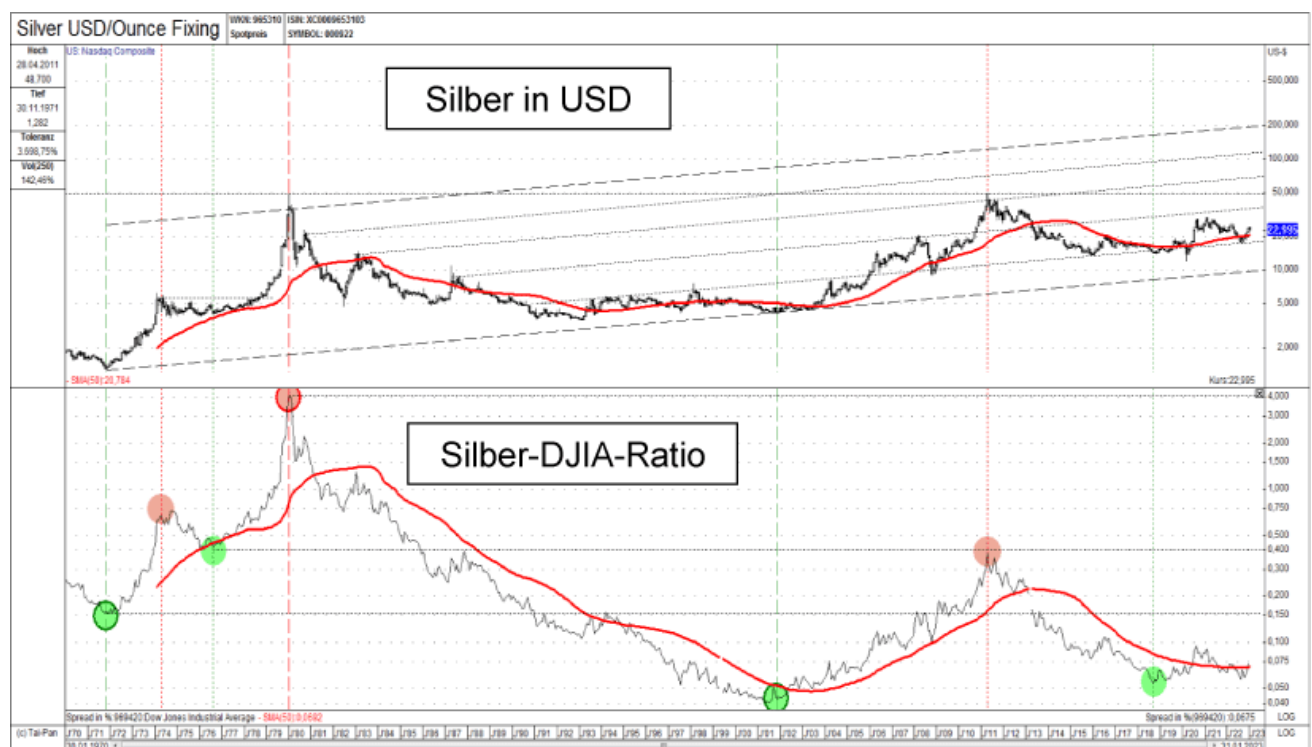
Abb. 2: Silberpreis in USD (oben) versus Silber-DJIA-Ratio (unten) von 01/1979 bis 01/2023

Rohstoffinvestments, besonders Silber und Edelmetallaktien, sind relativ (gegenüber dem DJIA) betrachtet epochal unterbewertet!