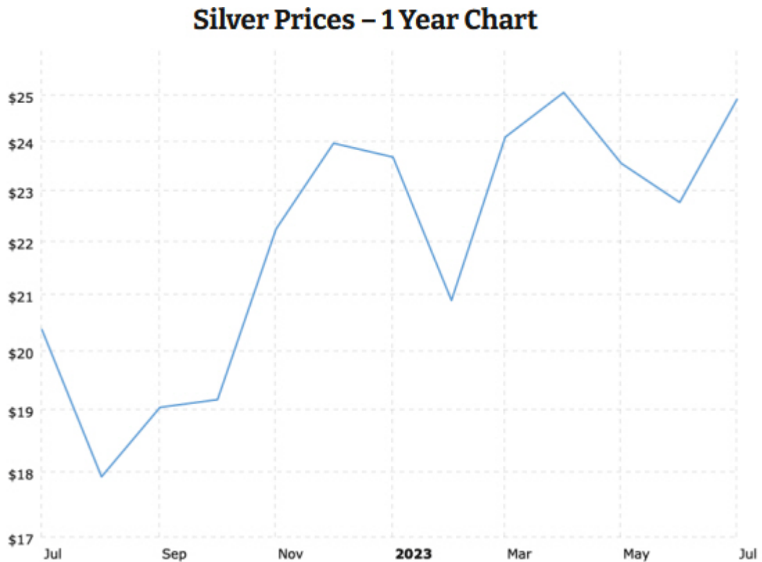
Silberpreis - 1-Jahreschart