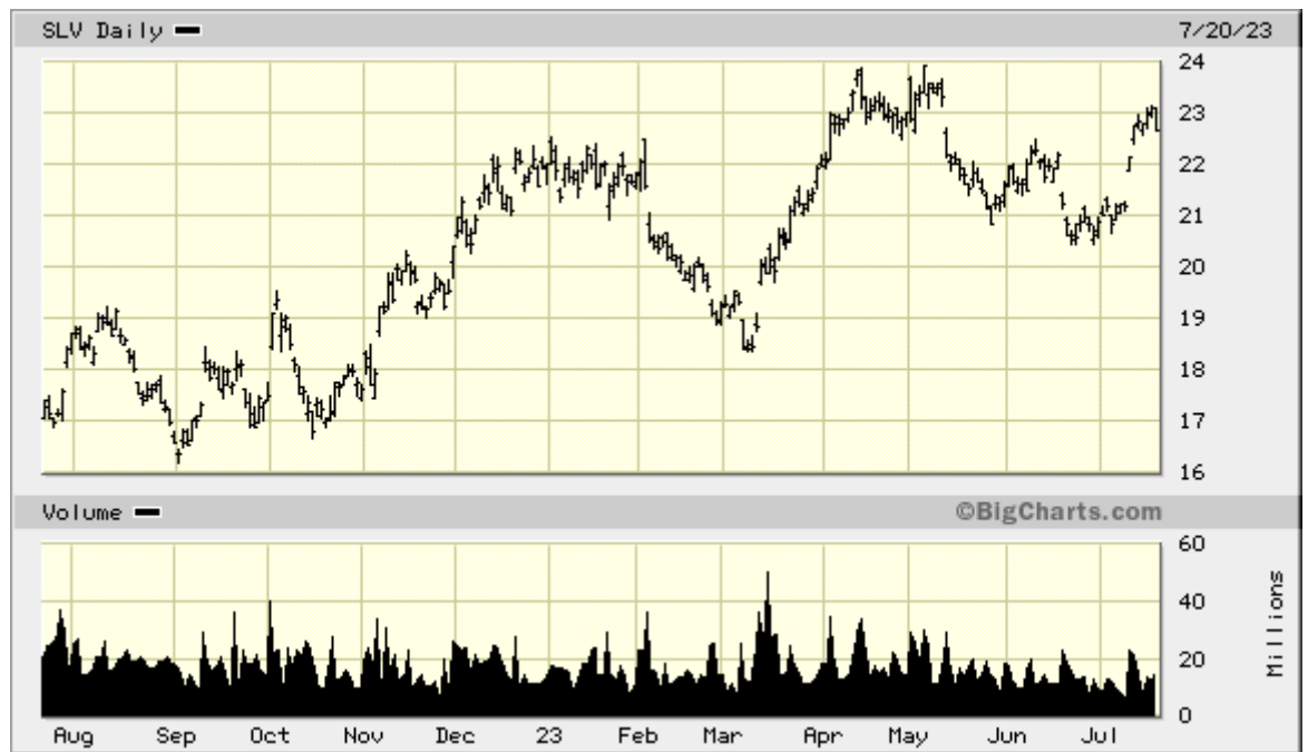
SLV (Silber-ETF) 1-Jahreschart

Bislang hat der Silberpreis seinen Höchststand von Anfang des Jahres noch nicht überschritten, aber das könnte bei der derzeitigen Dynamik schnell passieren. Wenn der Silberpreis seinen bisherigen Höchststand aus diesem Jahr übertrifft, könnte er sich durchaus weiter in Richtung 30 Dollar bewegen. Die zinsbullische Tendenz einiger Stacker, Vermarkter und Analysten könnte zu der Annahme verleiten, dass die 30-Dollar-Unze eine ausgemachte Sache ist. Vielleicht, vielleicht auch nicht. Werfen wir einen Blick darauf.