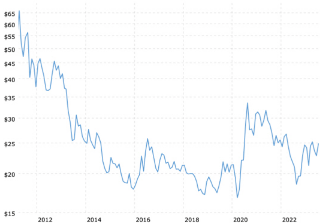
Silberpreise (inflationbereinigt) seit 2011