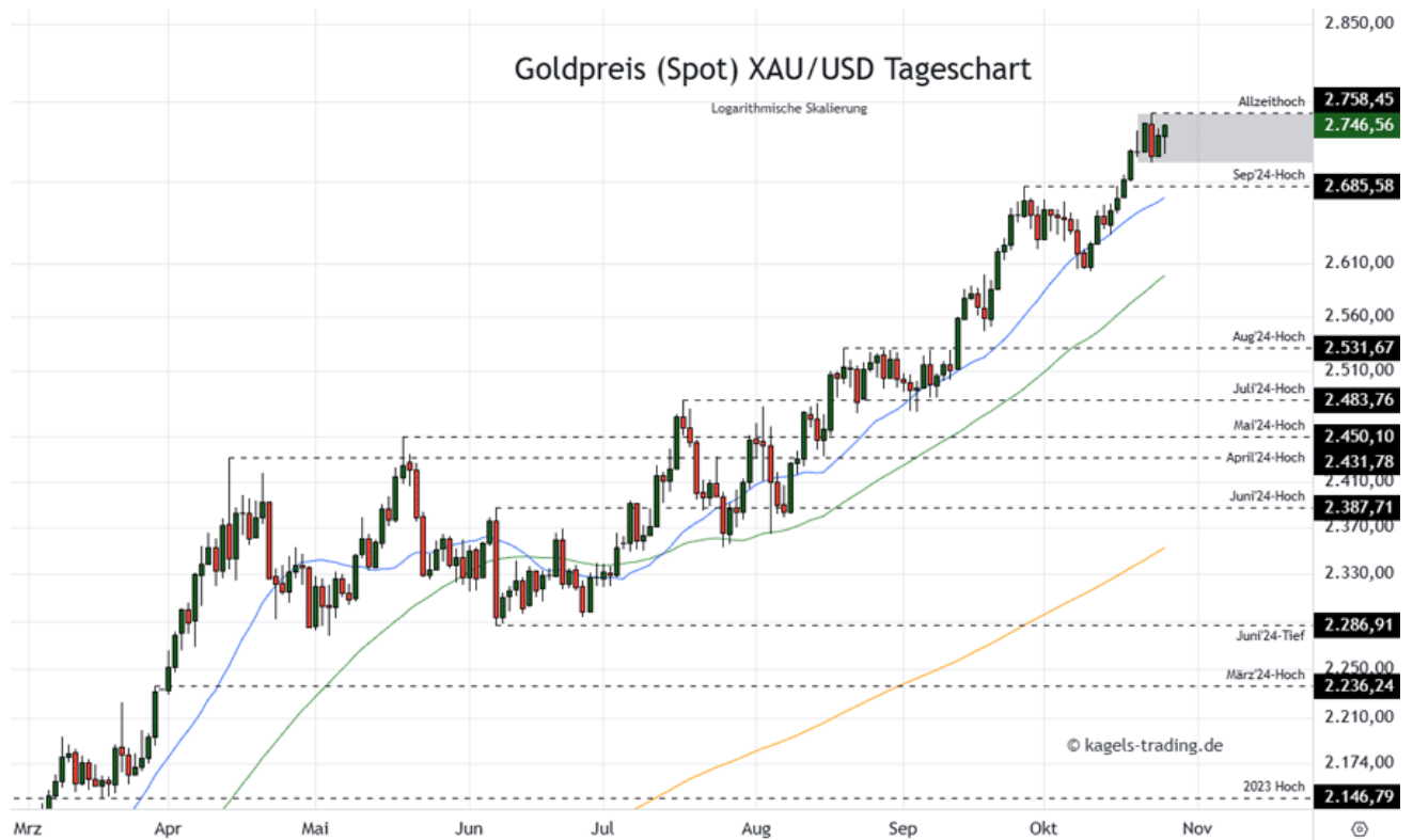
Goldpreis Prognose Tageschart - diese & nächste Woche (Chart: TradingView )

&#149; Mögliche Wochenspanne: 2.740 $ bis 2.810 $ alternativ 2.700 $ bis 2.745 $