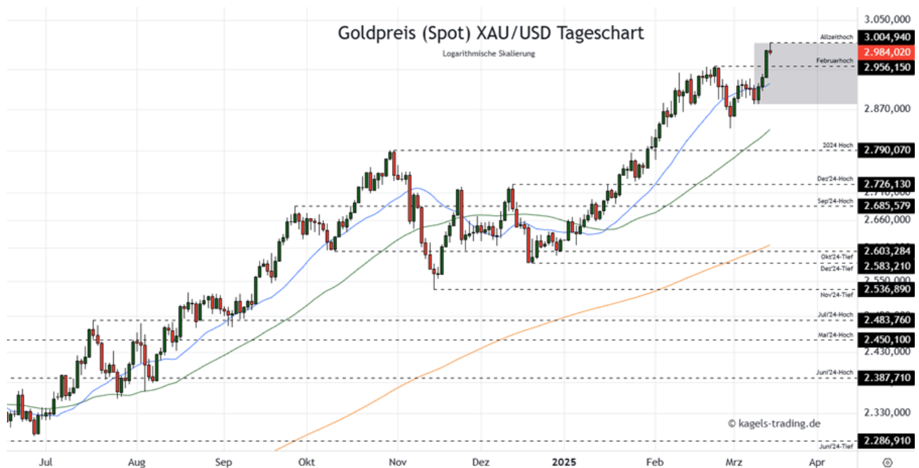
Goldpreis Prognose Tageschart - diese & nächste Woche (Chart: TradingView )

&#149; Mögliche Wochenspanne: 2.900 $ bis 3.030 $ alternativ 2.970 $ bis 3.110 $