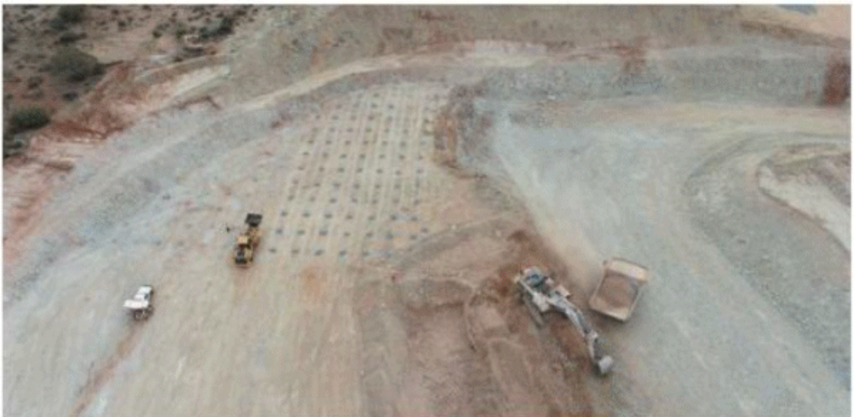
Plates 1 to 3 from top: view looking NW, Stage 1 West Lode mining, view of drill blast pattern (bottom)