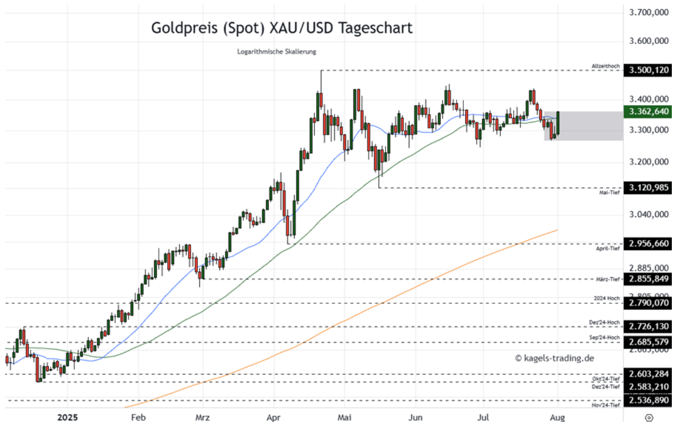
Goldpreis Prognose Tageschart - diese & nächste Woche

➤ Mögliche Wochenspanne: 3.390 $ bis 3.560 $ alternativ 3.290 $ bis 3.430 $